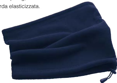
Art. PC 128 SC Scaldacollo 100% poliestere anti-pilling, regolazione a corda elasticizzata.