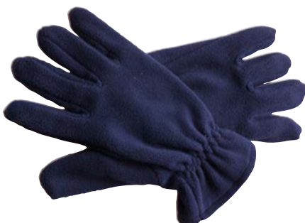
Art. PC 119 G Guanti 100% poliestere anti-pilling