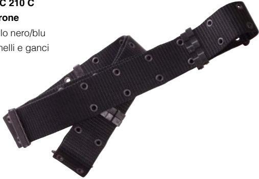
Art. PC 210 C Cinturone Modello nero/blu con anelli e ganci