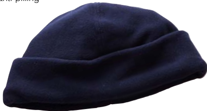
Art. PC 118 Z Zuccotto 100% poliestere anti-pilling