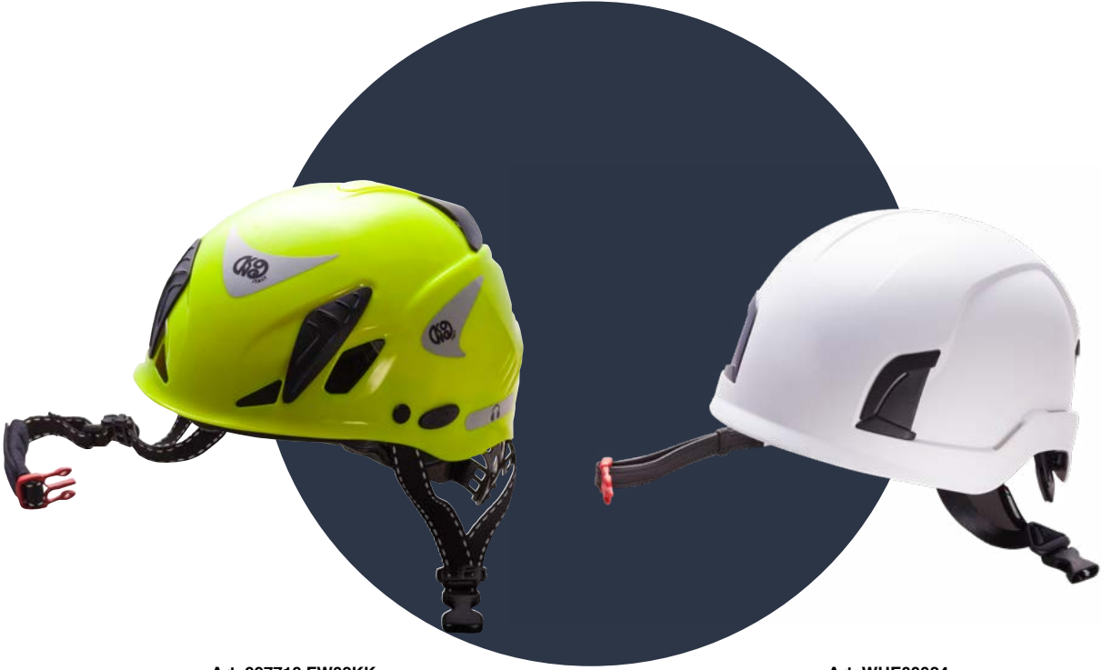
Art. 997718 FW02KK Casco Kong