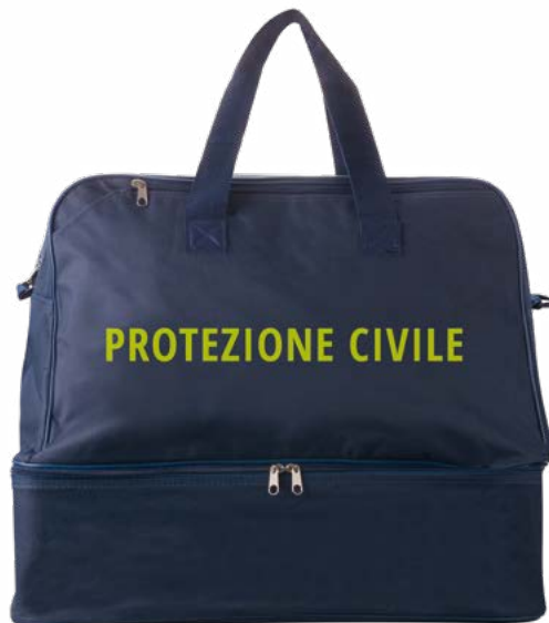
Art. PC 06129 Borsone